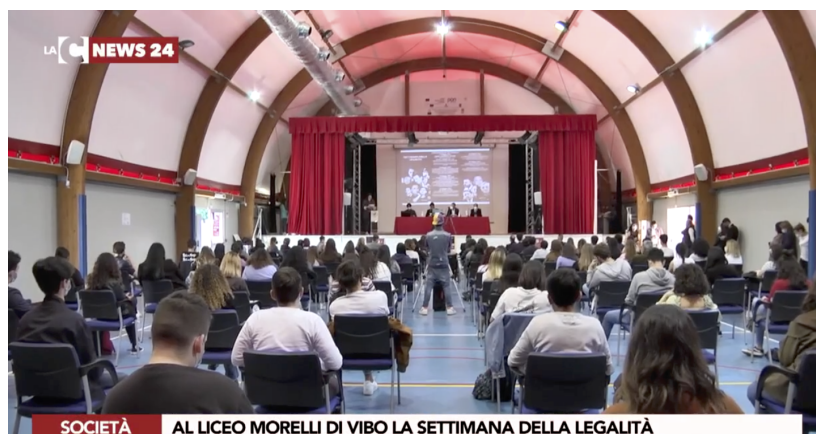
SOCIETÀ AL LICEO MORELLI DI VIBO LA SETTIMANA DELLA LEGALITÀ

L'educazione alla legalità in un contesto mafioso come quello Vibonese è quasi un obbligo morale a cui la scuola come istituzione formativa non può sottrarsi. Educare al rispetto delle regole nella vita sociale, ai valori della democrazia, all'esercizio dei diritti di cittadinanza significa diffondere nelle nuove generazioni la cultura dei valori civili, del dialogo e della tolleranza per affermare, in un territorio così difficile, il diritto di vivere in un paese civile. Ma educare alla legalità vuol dire in primo luogo praticarla: l'impegno personale per rispettare le regole, anche quelle quotidiane della vita scolastica, non devono essere vissute come puri comportamenti obbligatori, ma devono essere percepite ed attuate con consapevolezza e partecipazione. Per questo gli stessi alunni sono stati promotori di iniziative volte a diffondere la cultura della legalità, organizzando convegni, incontri, occasioni di riflessioni. Il loro impegno si è tradotto anche in operatività fattiva sul campo attraverso la cooperazione con le organizzazioni antimafia presenti sul territorio.